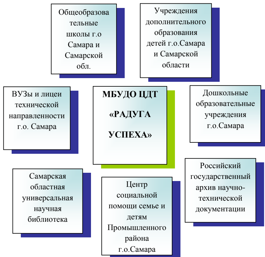
Модель государственного партнерства

Целью данного сотрудничества является популяризация направлений деятельности, вовлечение в образовательный процесс потенциальных участников, распространение опыта работы ЦДТ «Радуга успеха».