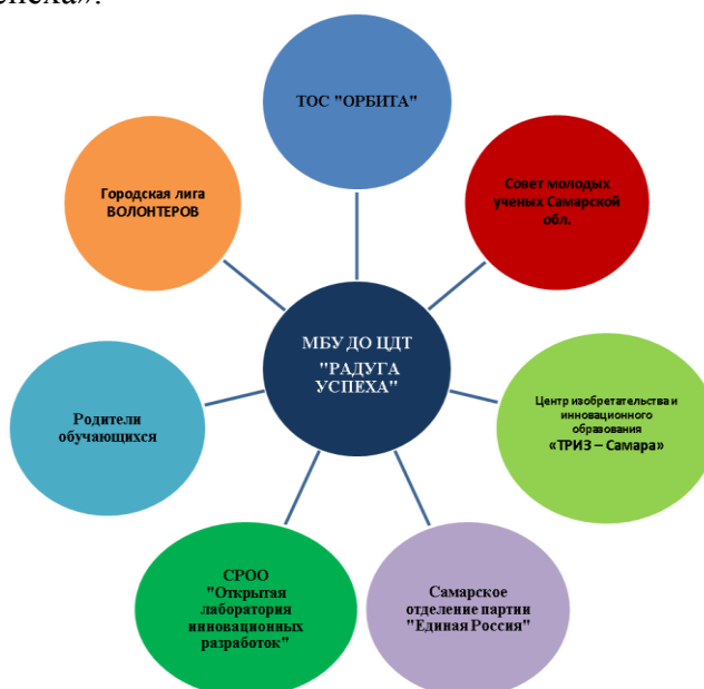
Модель государственно-общественного партнерства

Целью данного сотрудничества является популяризация направлений деятельности, вовлечение в образовательный процесс потенциальных участников, распространение опыта работы ЦДТ «Радуга успеха».